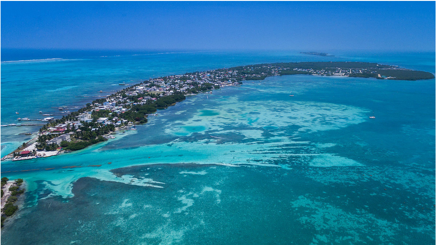
Figura 1: Caye Caulker, Belice; Fuente: Wikipedia commons